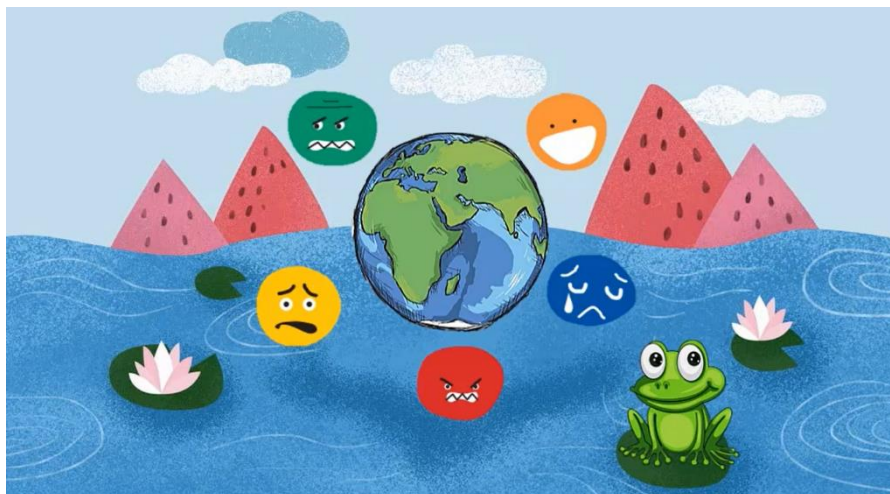
Nuotrauka nr.1. Akimirka iš filmuko, kai varlytė Nina pristato emocijų pasaulį.

Mažeikių lopšelis-darželis „Žilvitis“ dirba ir karantino laikotarpiu, tačiau didelė dalis ugdytinių šiuo laikotarpiu ugdomi namuose. Rūpindamiesi namuose esančių vaikų emocine gerove ir emocinio raštingumo ugdymu, kvietėme vaikus bendradarbiauti nuotoliniu būdu. Specialiai mūsų darželio ugdytiniams buvo sukurtas filmukas apie varlytę Niną, kuri atėjusi į darželį ir neradusi vaikų, nusprendė apsilankyti pas vaikus namuose ir kartu su savimi atsinešė netgi visą emocijų pasaulį (žiūrėti nuotrauką Nr.1).